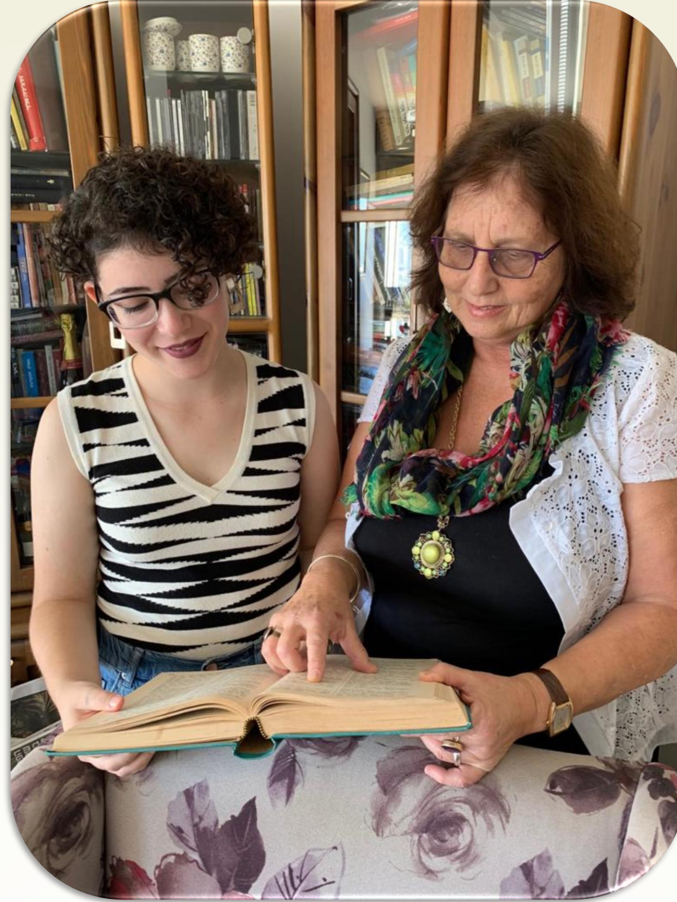
יש בסוגיה הזאת פנים לכאן ולכאן'

בעבודה התודעתני אל רעיונות, מושגים ושיטות של הבלשנות המודרנית: דיאכרוני-סינכרוני, הרמנויטיקה, גרמטיקליזציה והחוויה, שדות סמנטיים ותהליכי הפשטה מטפוריים. באמצעות מושגים אלו ניתחתי דוגמאות שונות משש תקופות נבחרות: המקרא, חז"ל – משנה, תלמוד ומדרשים, ימי הביניים – פיוטים והגות, תחיית השפה העברית מראשית ההשכלה ועד העברית החדשה. בשלב הראשון של המחקר חקרתי את הרובד המקראי בעזרת הקונקורדנציה של מנדלקארן המאורגנת לפי שורשים. בשלב השני עקבתי אחר שינויי משמעות של המילה 'פנים' ונגזרותיה באמצעות מנוע החיפוש האקדמי 'מאגריס' של המילון ההיסטורי של האקדמיה ללשון העברית.